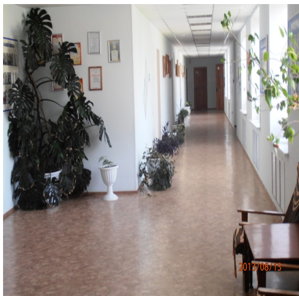
Фото №7. Коридор