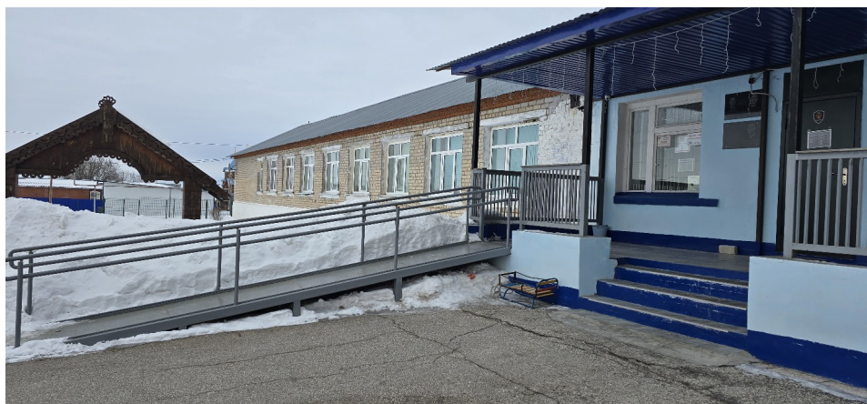
Фото №4 /б Пандус (наружный)