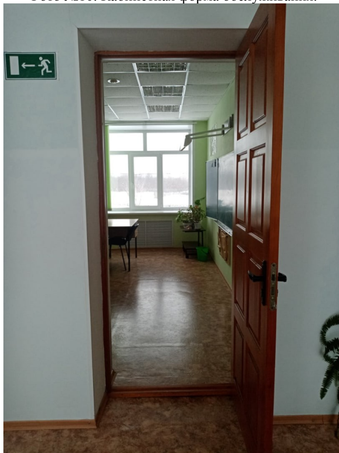
Фото №10. Кабинетная форма обслуживания.