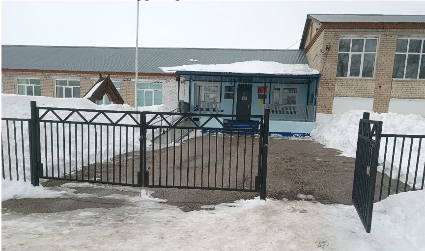
Фото №1 Вход на территорию