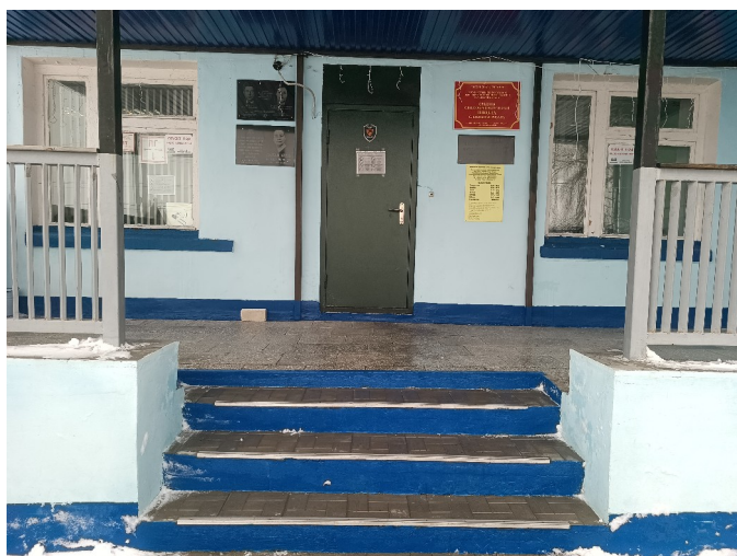
Фото №4/а Лестница (наружная)