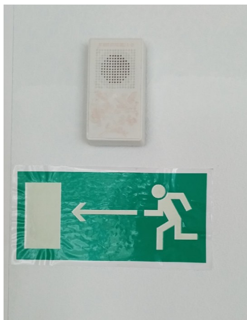
Фото №19 Акустические средства оповещения