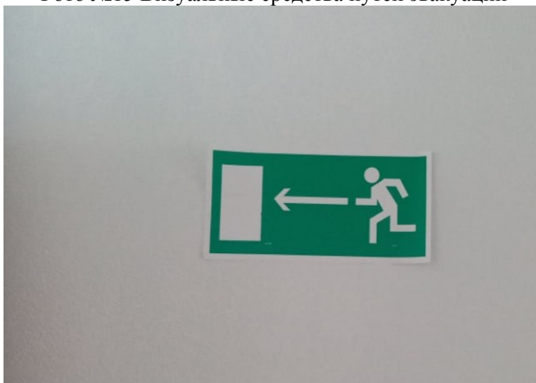
Фото №15 Визуальные средства путей эвакуации