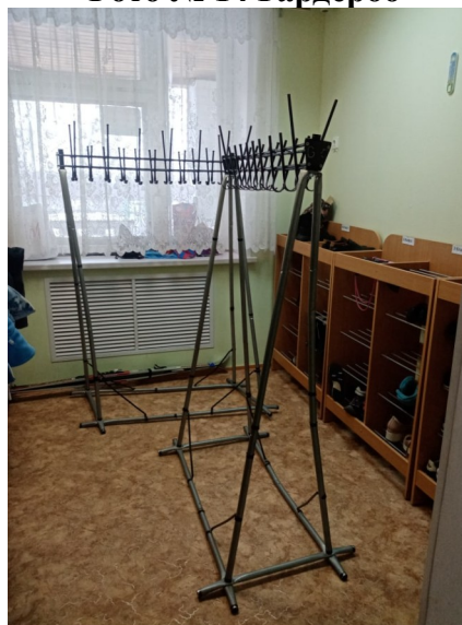
Фото № 14 Гардероб