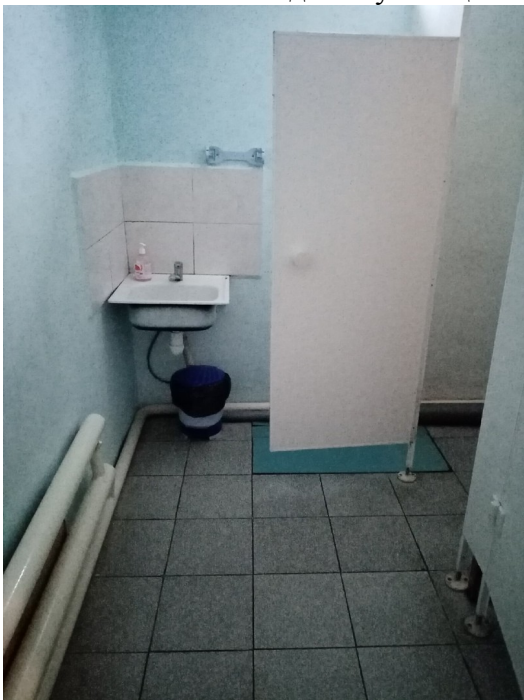
Фото № 12 Раковина для обучающихся