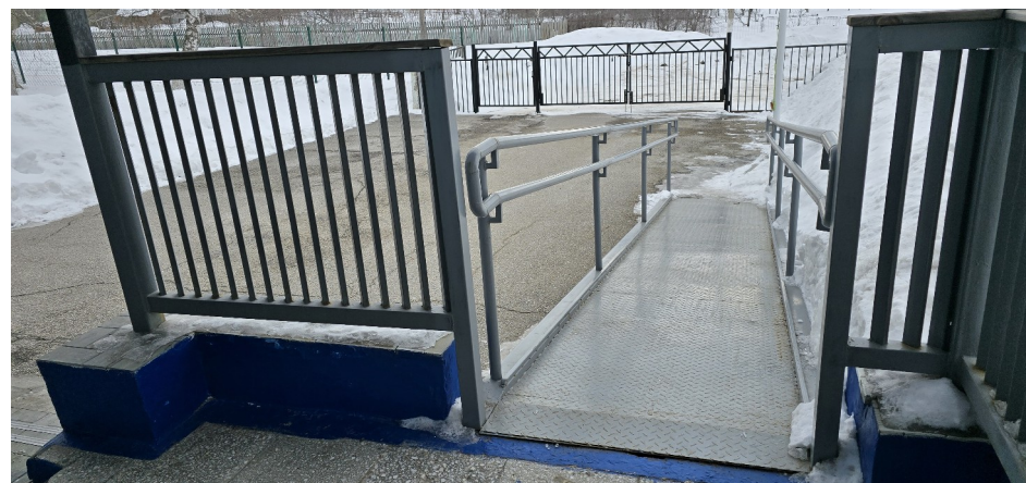
Фото №4 /в Пандус (наружный)