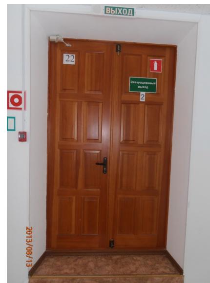
Фото №8. Путь эвакуации.